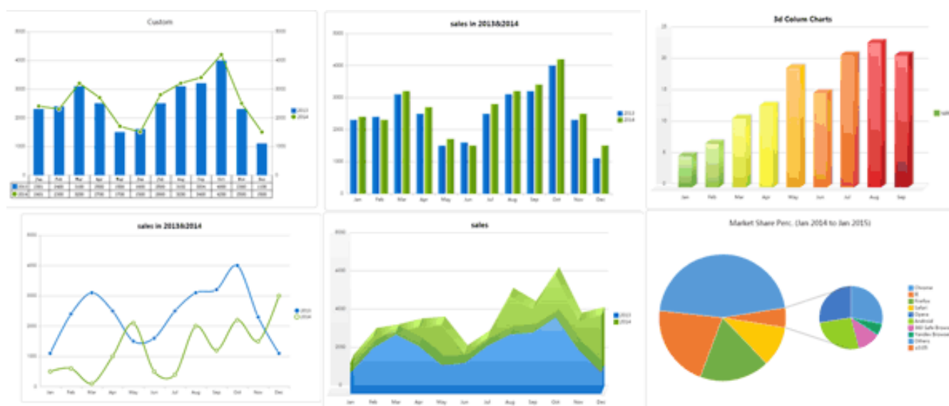
Рисунок Б.4 – Динаміка доходів і витрат АТ «ААА» за (n-5)-(n-1) pp.