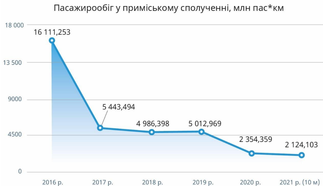
Рис. 1. Пасажиروبіг АТ «Укрзалізниця» в 2016-2021 роках

Особливе занепокоєння викликає не лише об'єктивне зниження обсягів пасажирських перевезень залізничним транспортом, але й зниження частки залізничного транспорту в загальному пасажиробігу по країні. Залізничний транспорт має найвищі з-поміж інших видів транспорту показники надійності та екологічності, а тарифна політика робить його єдиним доступним видом транспорту для соціально-незахищених верств населення. Цей факт вимагає вжиття комплексу заходів задля врегулювання ситуації та зміни негативної динаміки.