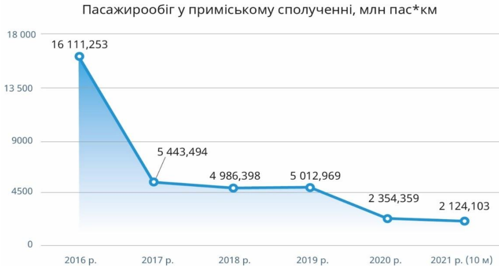
Рис. 1. Пасажи́рообі́рот АТ «Укрзалі́зниця» у 2016-2021 рр.

Із початком пандемії COVID-19 з березня 2020 р. через запроваджені карантинні обмеження як країнами Європейського Союзу, так і Україною міжнародні пасажирські перевезення були зупинені і до листопада 2022 р. фактично не здійснювались.