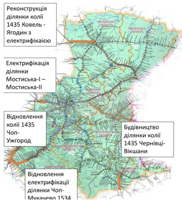
Рис. 3. Схема розміщення інфраструктурних проєктів, спрямованих на розвиток мережі міжнародних пасажирських перевезень

Розташування запропонованих інфраструктурних проєктів зображено на схемі рис. 3.