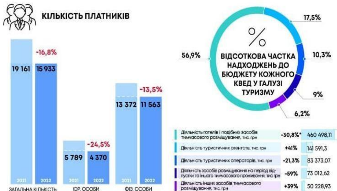
Рис. 1. Податкові надходження від туризму за перше півріччя 2022 р. [13]

Що стосується в'їзного туристичного трафіку, то ситуація наразі є надзвичайно складною, оскільки для туриста ключову роль відіграє безпека, тому туристичний потік іноземців буде збільшуватися лише після визнання безпечності українських територій. У свою чергу, внутрішній туризм наразі представлений в більшій мірі внутрішньопереміщеними особами.