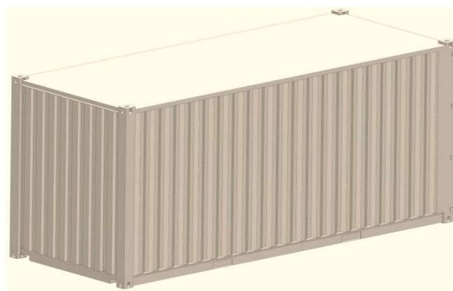
Рис. 2. Просторова модель контейнера

При складанні скінчено-елементної моделі застосовано ізопараметричні тетраедри. Їх чисельність визначено графоаналітичним розрахунком. Матеріал конструкції контейнера – сталь марки 09Г2С, яка має межу міцності 490 МПа та межу плинності – 345 МПа. Закріплення контейнера здійснювалось в зонах його спирання на фітингові упори, приварені до підлоги напіввагона.