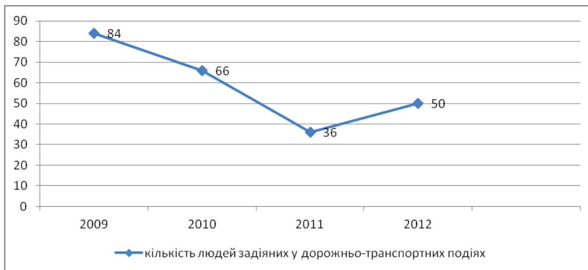
Рис. 4. Кількість людей задіяних у дорожньо-транспортних подіях на залізничних переїздах Укрзалізниці.

Як наведене вище дорожньо-транспортна подія з тяжкими наслідками у вигляді загиблих та травмованих відноситься до аварії або катастрофи. Рисунок 4 свідчить про кількість таких подій на залізницях України. Коли річ йде о переїздах безумовно не можна казати о економії за рахунок людського життя, тому в даному випадку треба говорити про підвищення безпеки будь-якою ціною (будівництво шляхопроводів, обладнання переїздів загороджувальними бар'єрами, тобто покращення оснащення в залежності від інтенсивності руху в потяго-екіпажах)