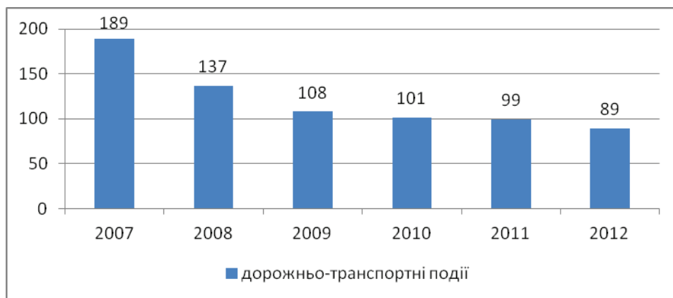
Рис. 2. Статистика дорожньо-транспортних подій на переїздах Укрзалізниці

За сім місяців 2013 року на залізничних переїздах скоєно 46 дорожньо-транспортних подій. За дев'ять місяців 2014 року