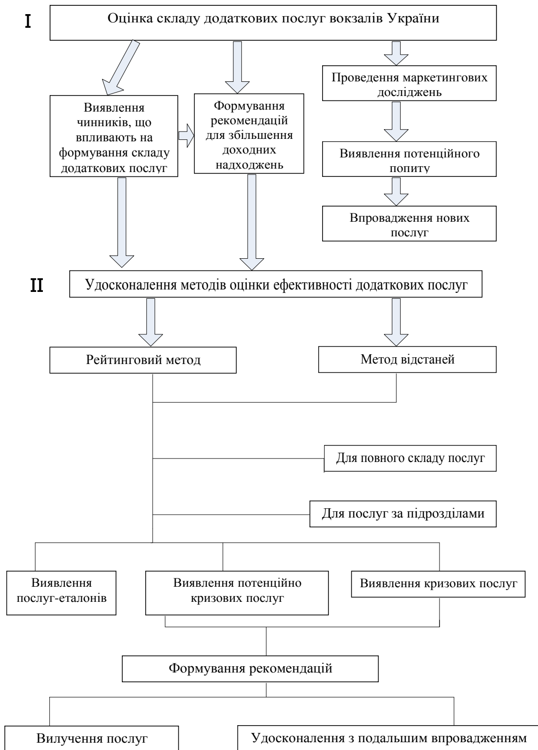
Рис. 1. Схема формування нових методів оцінки додаткових послуг