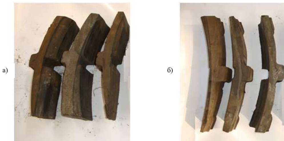
Рисунок 2 – Экземпляры изношенных тормозных колодок грузовых вагонов депо Основа: а – с «верхним клином»; б – с «нижним клином»

Приводятся результаты теоретических исследований, базирующихся на кинетостатическом анализе причин возникновения неравномерного износа колодок, связанных с торможением колес при одностороннем и двухстороннем их вращении (движении). Описываются результаты экспериментально-теоретических исследований явлений неравномерного износа тормозных колодок (рисунок 2) при опытной эксплуатации грузовых вагонов на железных дорогах Украины.