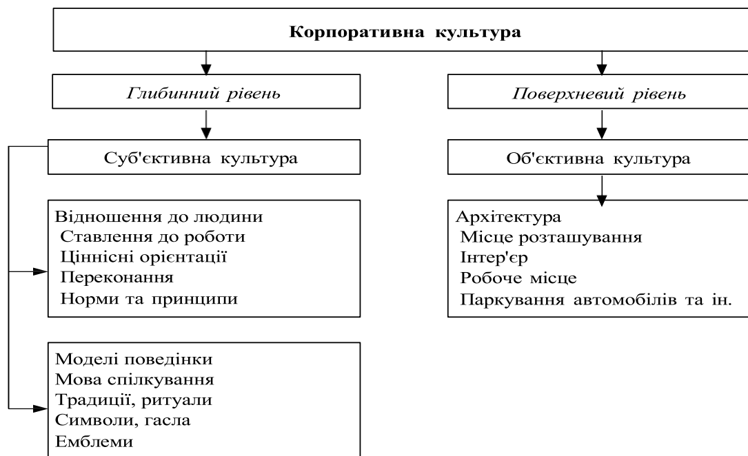
Рис. 2. Елементи корпоративної культури

- функція іміджу організації, відрізняє її від будь-якої іншої. формує певний імідж організації, що