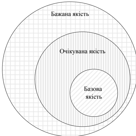
Рис.2 – Компоненти якості послуги

Для більш повної оцінки якості послуги споживачем варто додати елемент відповідності послуги очікуванням клієнта. Згідно з концепцією створення привабливої якості Н.Кано (рис.2), якість як туристської, так і будь-якої іншої послуги включає в себе три компоненти [9].