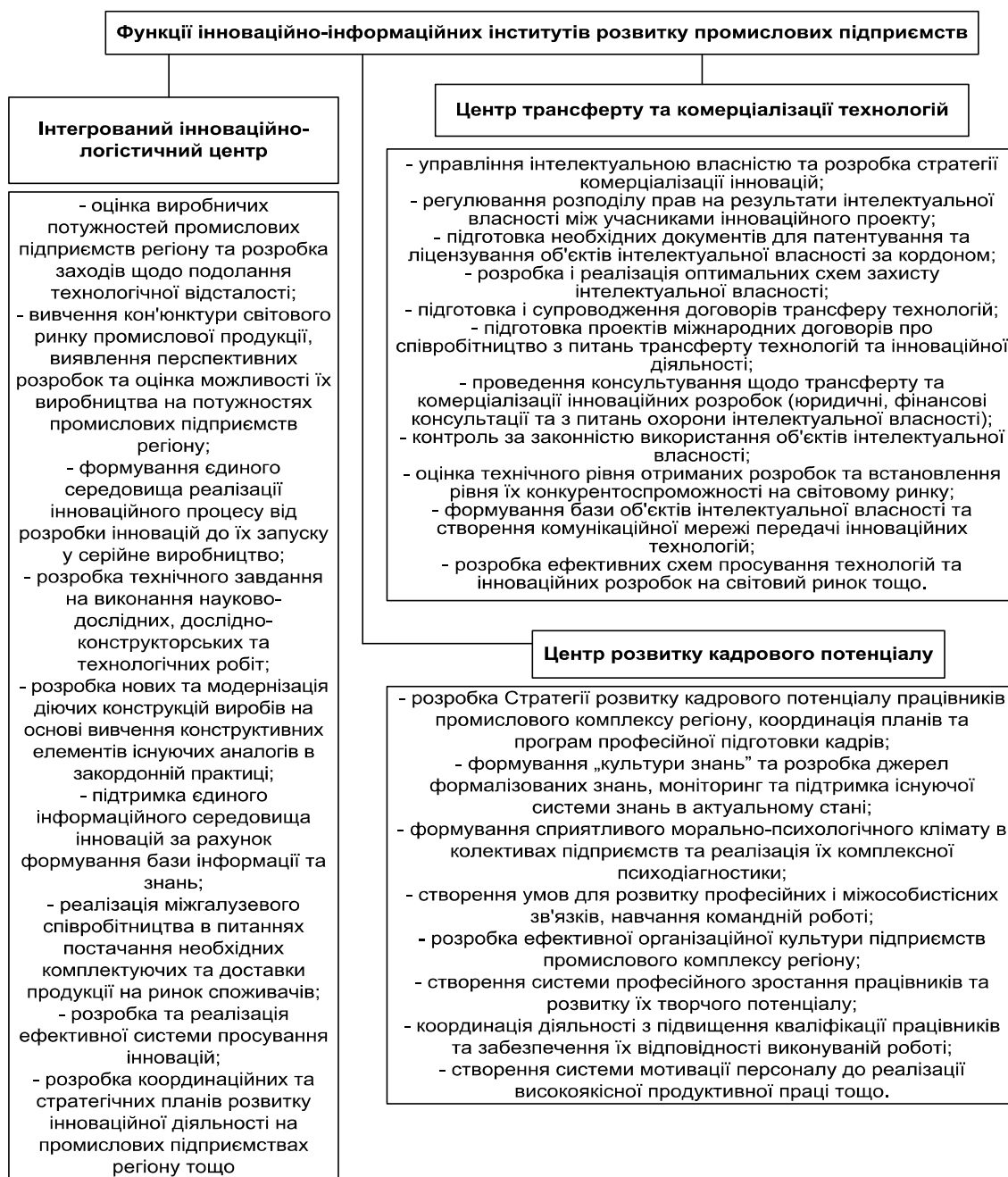
Рис. 1. Функції інноваційних інститутів розвитку промислових підприємств регіону

Створення Інтегрованого інноваційно-логістичного центру, Центру трансферу і комерціалізації інновацій та Центру розвитку кадрового потенціалу як інститутів створення, трансферу