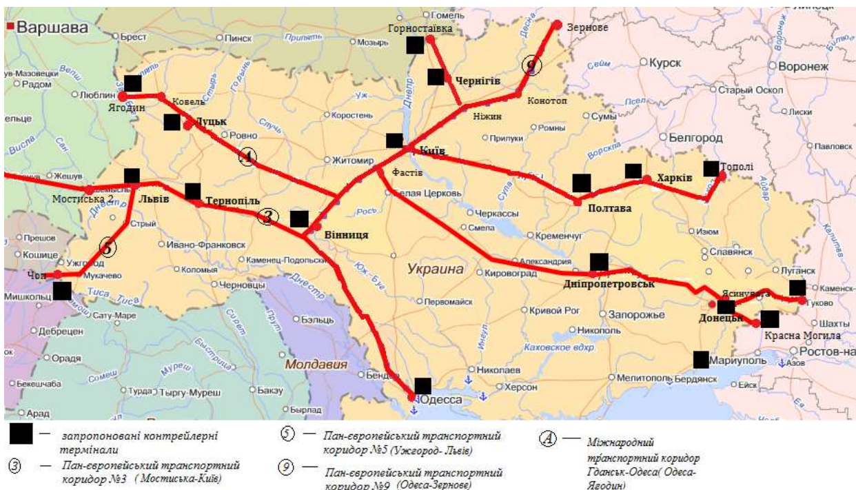
Рис. 2. Залізничні маршрути Транс'європейської центральної транспортної осі (Україна)