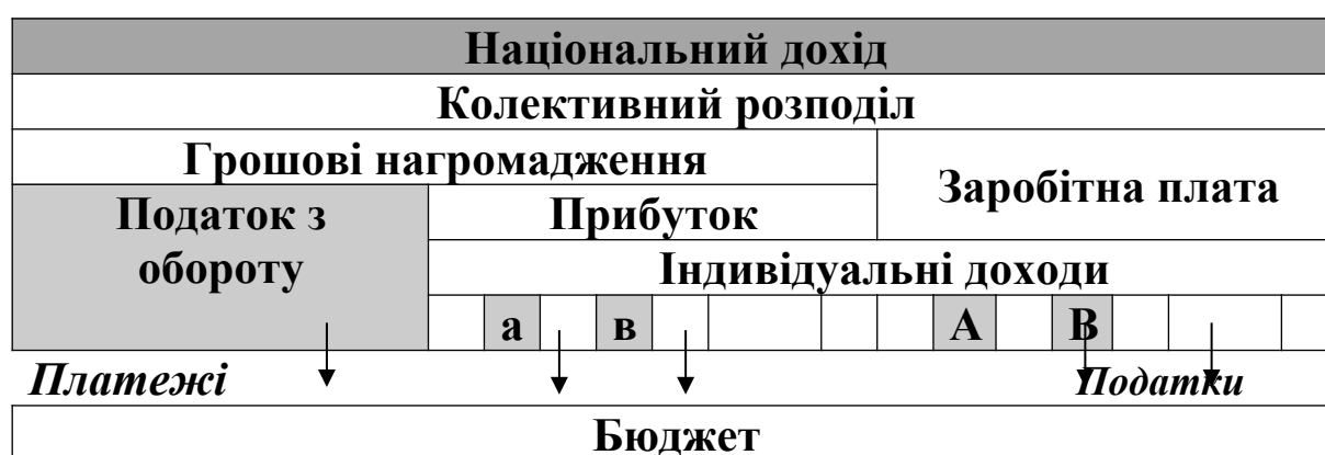
Рисунок 1.3 – Схема розподілу ВВП в умовах адміністративної економіки

Така система розподілу може бути представлена у вигляді схеми (рисунок 1.3).