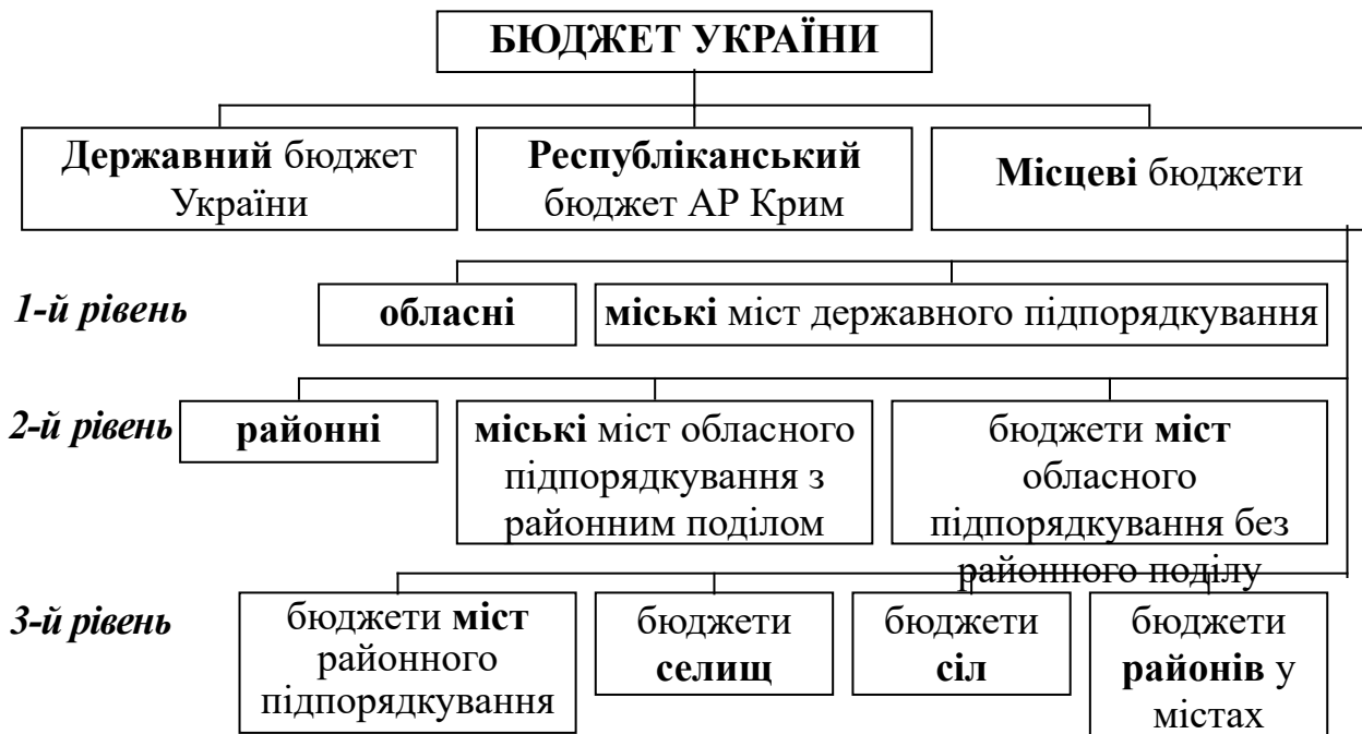
Рисунок 2.3 – Бюджетна система України