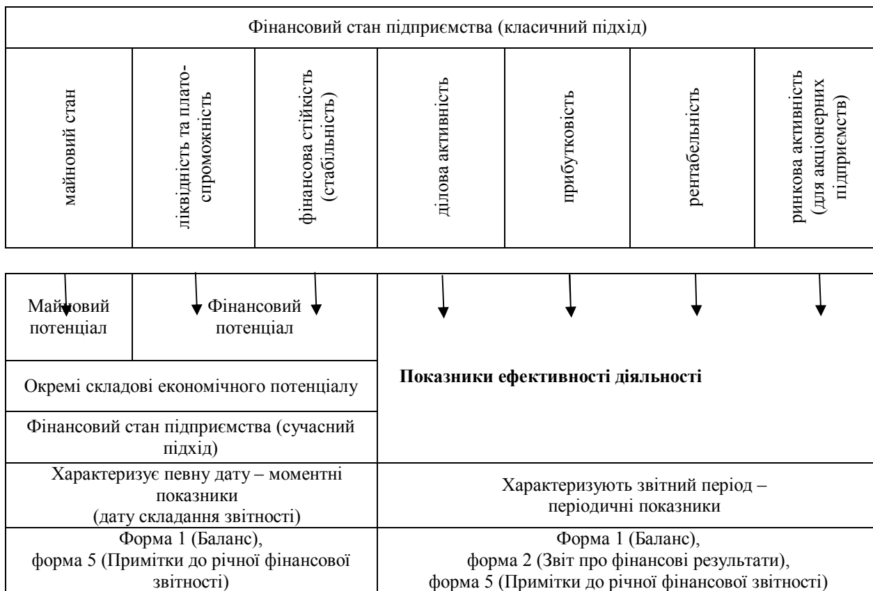
Рис. 1 – Взаємозв'язок складових економічного потенціалу і ефективності діяльності з фінансовим станом підприємства

Таким чином, складові фінансового стану, які характеризують період, можуть використовуватись для оцінки рівня ефективності діяльності.