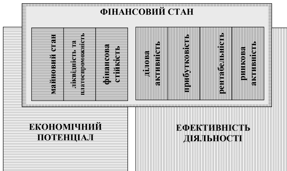
Рис. 2 – Взаємозв'язок категорій «фінансовий стан», «економічний потенціал» та «ефективність діяльності»