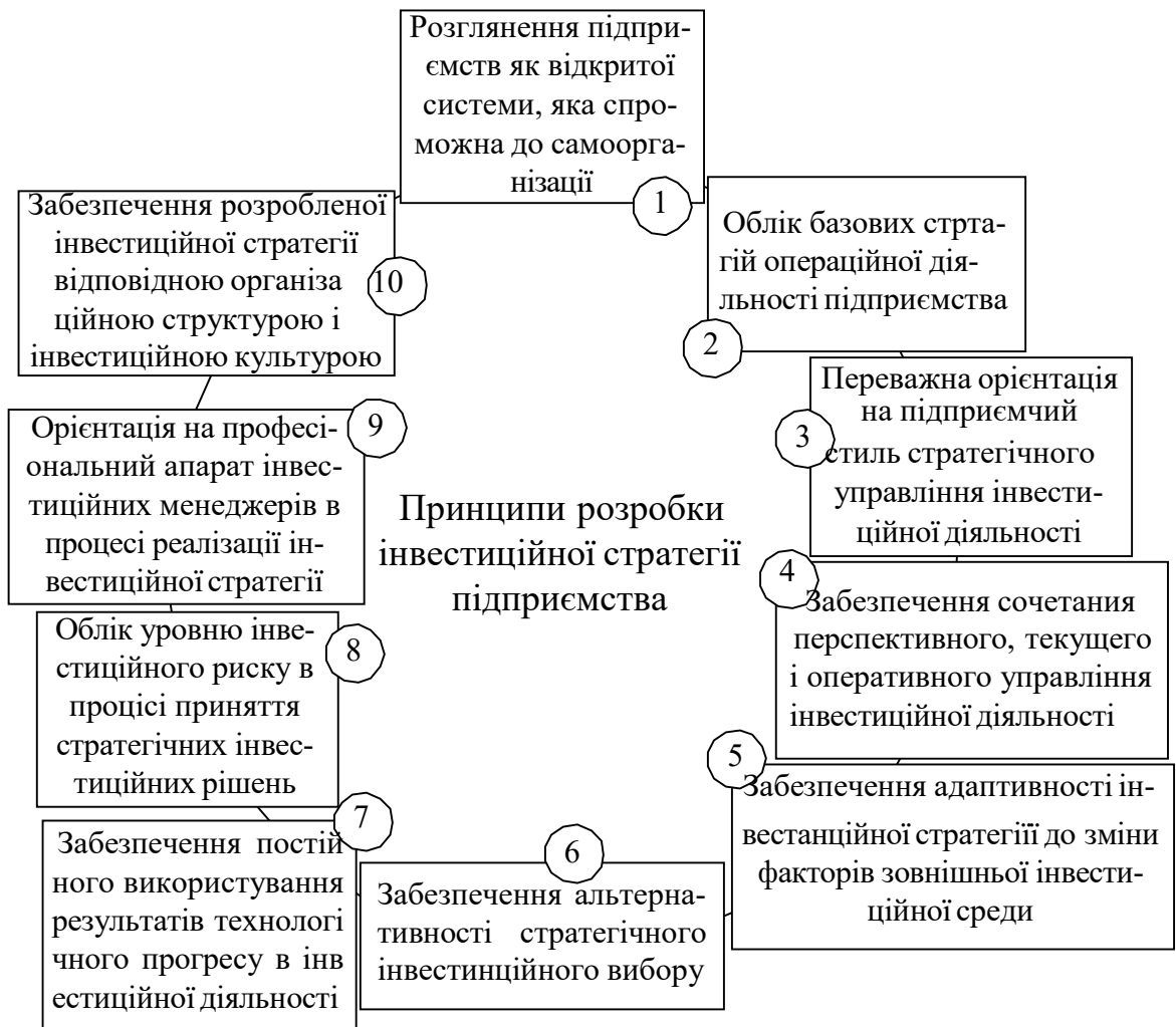
Рис. 1 — Головні принципи розробки інвестиційної стратегії

стратегічних інвестиційних рішень у підприємства, відносяться (рисунок 1): процесі розробки інвестиційної стратегії