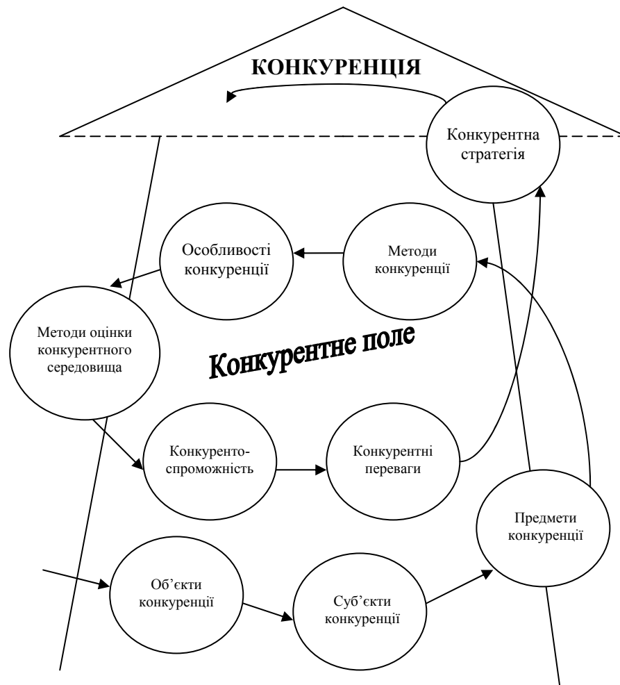
Рисунок 2 – Схема механізму конкуренції

оперативність, низьку вартість інфраструктури та наявність автомобільних шляхів, які дозволяють здійснити доставку до конкретного вантажоотримувача. Конкурентними перевагами залізничного транспорту – незалежність від природних умов, надійність поставки, низькі енерговитрати та наявність магістральних шляхів в райони, де рух автотранспорту ускладнено або відсутній [16]. До переліку останніх Рудаков О. М. додає: невисоку чутливість споживачів до зміни цін, слабку циклічність та сезонність попиту, відсутність послуг-замінників для перевезень деяких видів вантажів [17];