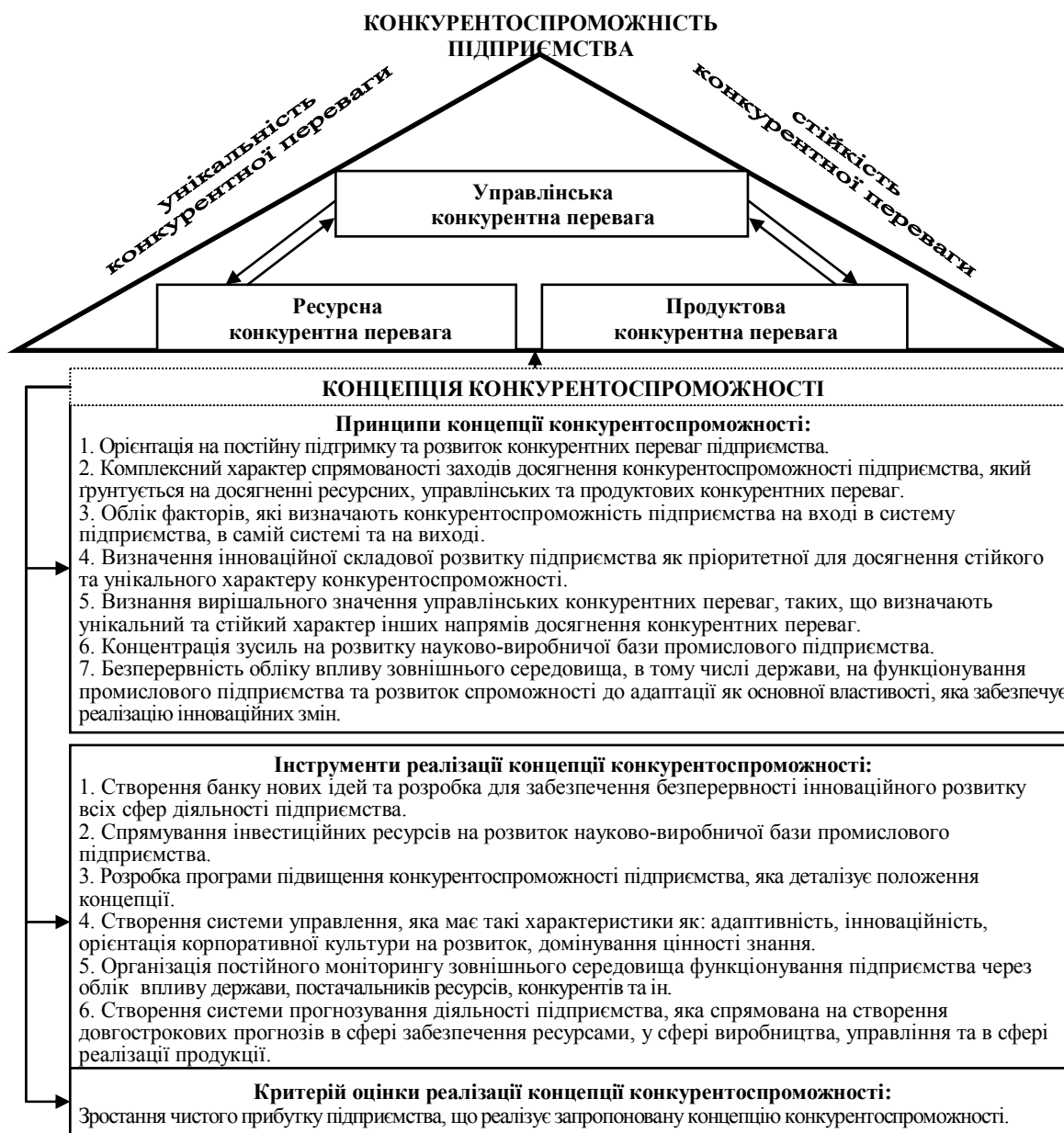
Рисунок 1 - Концепція конкурентоспроможності підприємств виробників рухомого складу для залізничного транспорту

характеристик менеджменту підприємства, домінуючими в забезпеченні загальної визначають ефективність системи управління та є конкурентоспроможності підприємства.